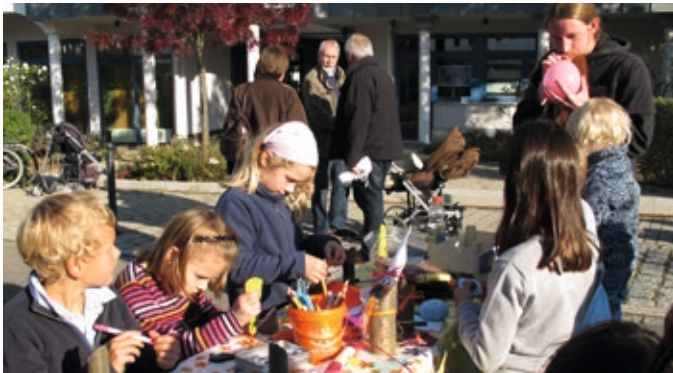
Basteln mit den Kleinen, die auf einmal ganz aufmerksam sind.

... und macht auch sonst, was euch Spaß macht. Die BGO kümmert sich schon immer um die Kleinen im Ort. Kids sind für uns keine lärmenden Störfaktoren, sondern der wichtigste Teil der Zukunft. Außerdem haben auch schon einige der heutigen Vorständler auf dem Bolzplatz unterhalb der Kirche Fußball gespielt – zu Zeiten als da noch ein Bächlein durchlief und die Häuserwiesenstraße nur teilweise asphaltiert war. Aber Spaß hat es gemacht, und so sind wir im Geist immer noch ein wenig jung geblieben und tun heute gerne was für den Nachwuchs.