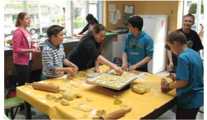
Gemeinsames Backen im Backhäusle.

Begeisterung beim Laternenumzug mit St. Martin an der Spitze.