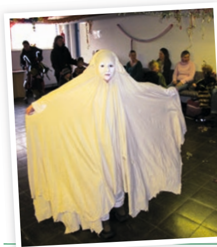
Kinderfasching:- Man könnte – fast – ein wenig Angst kriegen.