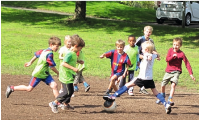
Sind das die Stars von morgen?